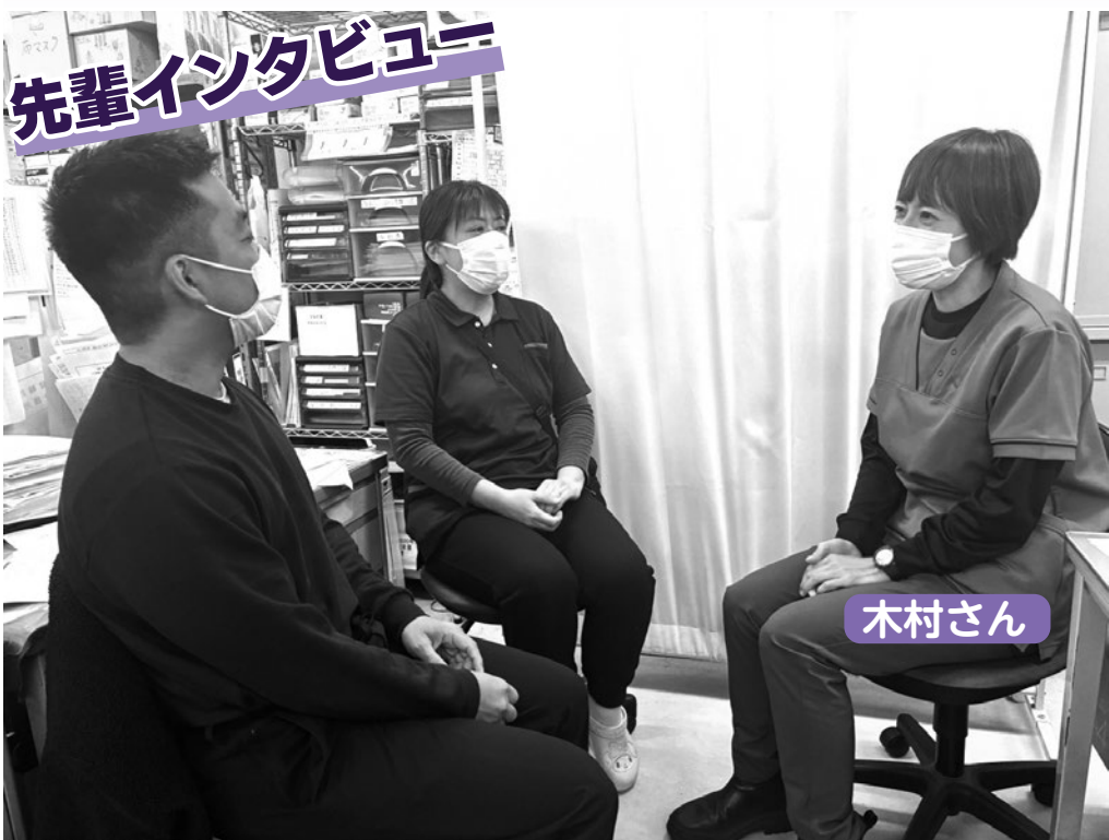
先輩インタビュー