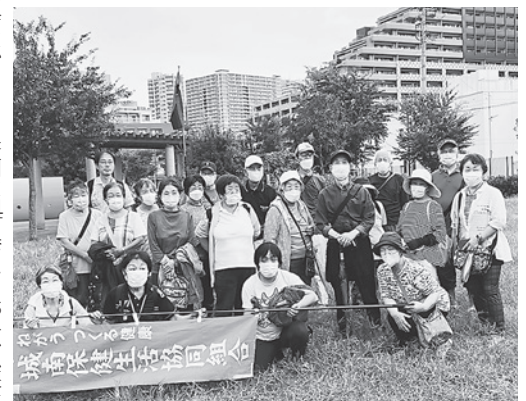
毎月元気に歩いています (第17回)

16回目のまち歩き会は、9月7日に開催しました。参加は21人で、今回は京急空港線大森橋からスタート。五十間鼻無縁仏堂を通り、赤煉瓦塀の道を抜けて、穴守稲荷神社・羽田神社を散策し、大鳥居駅までの約4.5kmのコースを楽しみました。 * * * * * 17回目のまち歩き会は、10月5日に開催、久しぶりの雨の中のまち歩き会となりました。