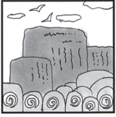
上野発の〇〇〇列車 降りた〇〇〇〇