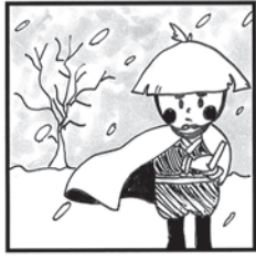
〇〇〇〇こぞうの かんたろう