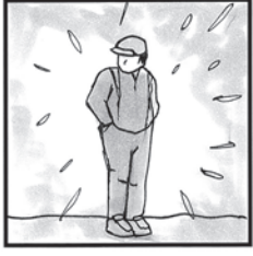
すきよあなた 〇〇〇〇いまでも

解き方は、イラスト横の色網のかかったワクの文字を並べると、ある言葉になります。それが答えです。今回は冬のうたの歌い出しです。答えのヒントは