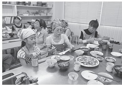
美味しく楽しい時間でした