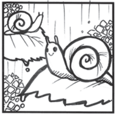
でんでんむしむし