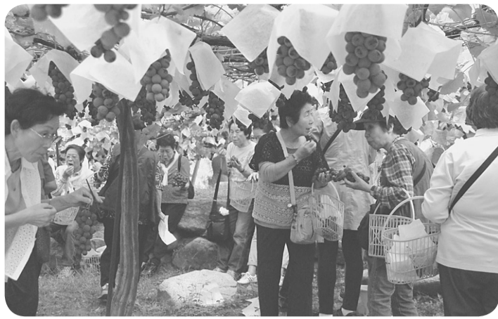
たわわに実ったぶどう「どれがいいかな？」

今回は感想を俳句や短歌、川柳に詠んでいただきました。ほかに、たくさんのお土産を寄せていただきましたが、紙面にお会いしましょう。(本部事務局)