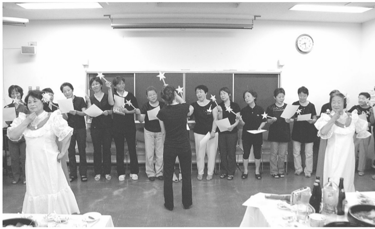
各事業所から出し物を披露 (写真は手話ダンス)