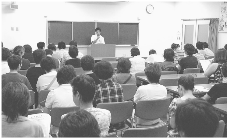
「かがやき事例」の発表を熱心に聴きました