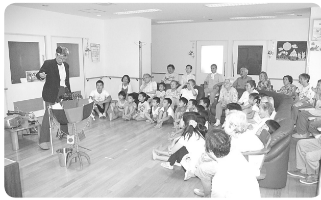
マジックショーに子どもたちは大喜び

たのびますが、「川歩きシリーズ」の最後となる目黒川を、荏原神社から目黒駅まで廻りました。川に沿って孟宗竹の東京での初栽培記念地点や日本初の官制の硝子工場跡などの碑を經由しながら歩きました(硝子工場跡は道路の反対側だったので見られませんでした)。