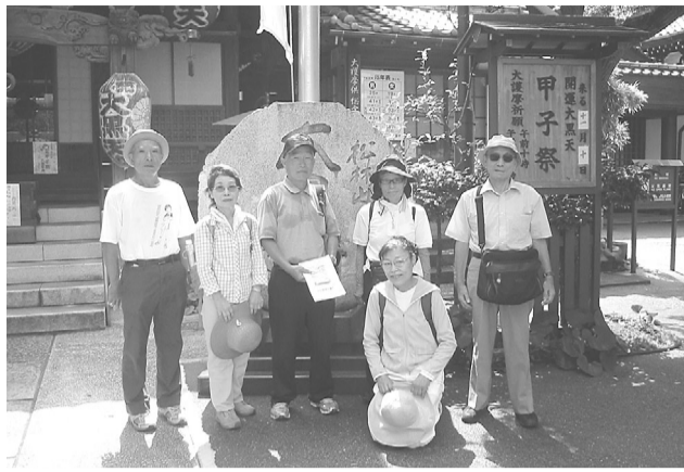
目黒行人坂大火の供養塔のある大円寺で