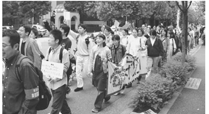
「社会保障を充実せよ」とデモ行進で訴えました

当日の集會は、日比谷公会堂並びに周辺で開催されました。日比谷公会堂は2074人が収用できますが、首都圏・関東圏・東信越以外の地方からの参加者でうまり、首都圏からの参加者は、公会堂の外にオーロラビジョンを設けての参加となりました。